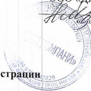
График приёма администрации

Запись на приём к администрации клиники осуществляется непосредственно в регистратуре или по телефонам +7 (929) 519-33-55 в рабочее время учреждения: с пн по вс с 9.00 до 21.00. Также всю контактную информацию Вы можете получить с сайта клиники https://luriz.ru/